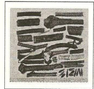
市售地上部藥材特徵圖